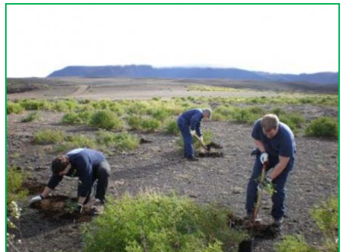
Tafla 9. Landgræðsla

Bílaleiga Akureyrar hefur um alllangt skeið unnið að landgræðslu og hefur nú svæði á Hólásandi í Suður Þingeyjasýslu til gróðursetningar. Það eru starfsmenn fyrirtækisins sem sjá um gróðursetninguna með aðstoð og leiðsögn sérfræðinga á sviði skógræktar. Með þessari vinnu leitast fyrirtækið við að sporna gegn þeim neikvæðu umhverfisáhrifum sem reksturinn hefur í för með sér. Með landgræðslu er unnið gegn losun gróðurhúsalofttegunda með aukinni kolefnisbindingu en auk þess má með landgræðslu draga úr gróðureyðingu og endurheimta örfoka land. Vorið 2009 samdi fyrirtækið við Norðurskóga um kaup á 1.861 trjáplöntu sem ráðgert var að gróðursetja í september sama ár. Tvær gróðursetningaferðir voru skipulagðar en féllu þær báðar niður vegna veðurs en vetur gekk óvenju snemma í garð á Norðurlandi. Plönturnar eru hinsvegar í eigu Bílaleigu Akureyrar og gróðursetning þeirra er áætluð vorið 2010 þegar aðstæður á Hólásandi leyfa.